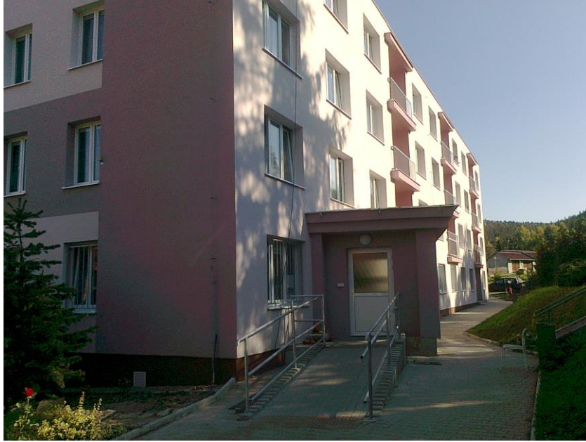
Domov pro seniory a Domov pro osoby se zdravotním postižením Mašťov